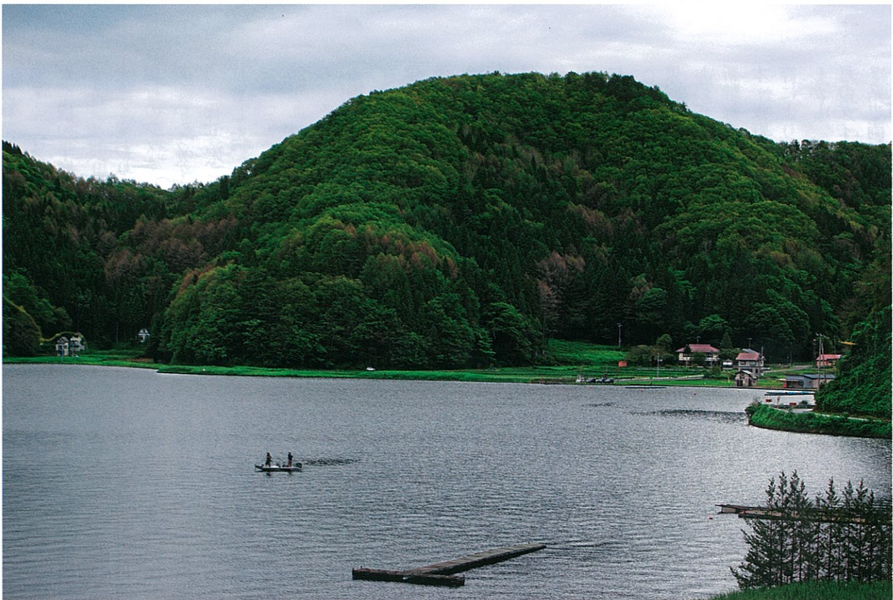
野 尻 湖 (信濃町) (駅ビル事業所 宮下 政和)