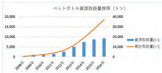
図2 資源回収量推移

トムラ・ジャパンは、RVMを利用して2016年は約9,300トン（約3億本（ペットボトル国内販売量の約1.5%））を回収。2008年7月の会社設立から累計約3.7万トンを回収し、2016年に累計10億本の回収を達成した。