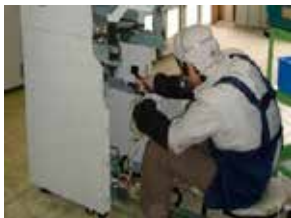
手分解による分解・分別

また、HDDには顧客の情報が格納されているため、物理的破壊を行い機密情報の漏えい防止を確実にしている。