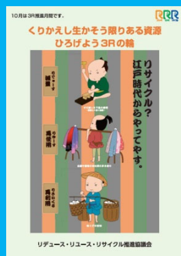
平成 26 年 (2014 年) 度