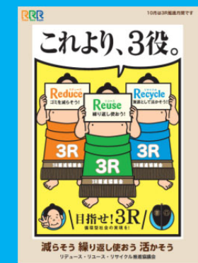
平成 30 年 (2018 年) 度