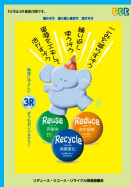
平成 27 年 (2015 年) 度