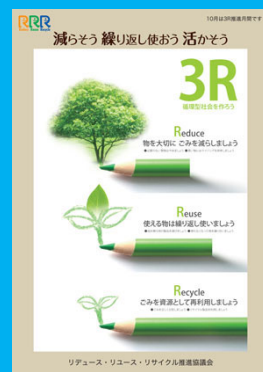
平成 28 年 (2016 年) 度