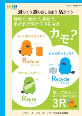
平成 29 年 (2017 年) 度