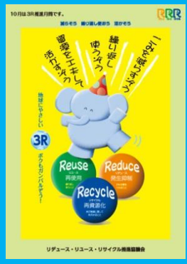
平成 27 年度