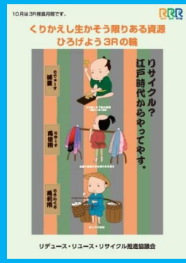
平成 26 年度