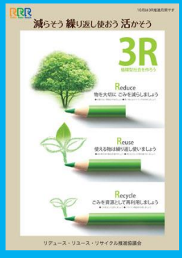
平成 28 年度