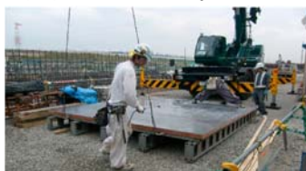
ステンレスパネル大型枠 再利用可能な材料の使用

函体工型枠に再利用可能なステンレスパネルを使用（累計 3,150 m 2 ）や、大型枠化などにより木材使用及びその廃棄物の低減を図っている。