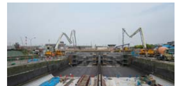
土留支保工を削減した施工

土留構造を切梁式から自立式土留壁（全体施工量の約 90%）とした。これにより当初計画の土留支保工材 1,230t、鋼材消耗品約 50t を削減。さらに、この削減は躯体工施工時の型枠材等資機材の低減にも寄与している。