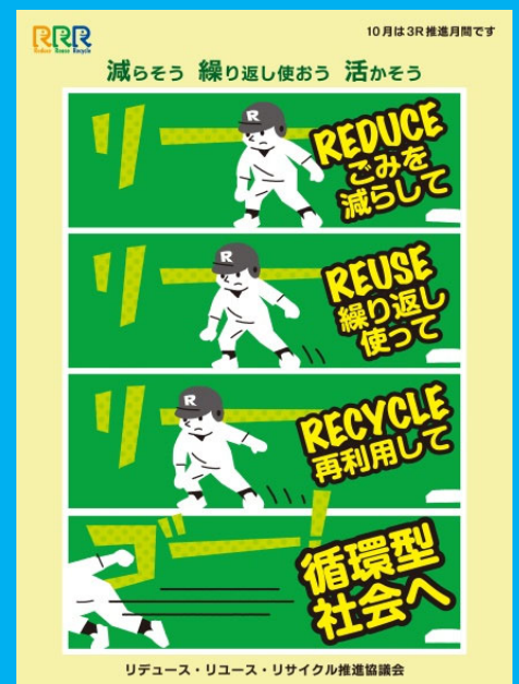
2020年度 最優秀賞作品

3R推進ポスターは、工場、工事現場、オフィス、店舗などのビジネス現場や公共の場において、事業者に3R（リデュース・リユース・リサイクル）活動の推進を促すためのポスターです。毎年10月の3R推進月間に向けて3R推進ポスターを配布し、ビジネスの現場や公共機関などで3R活動への参画の呼びかけなどにご活用いただいています。