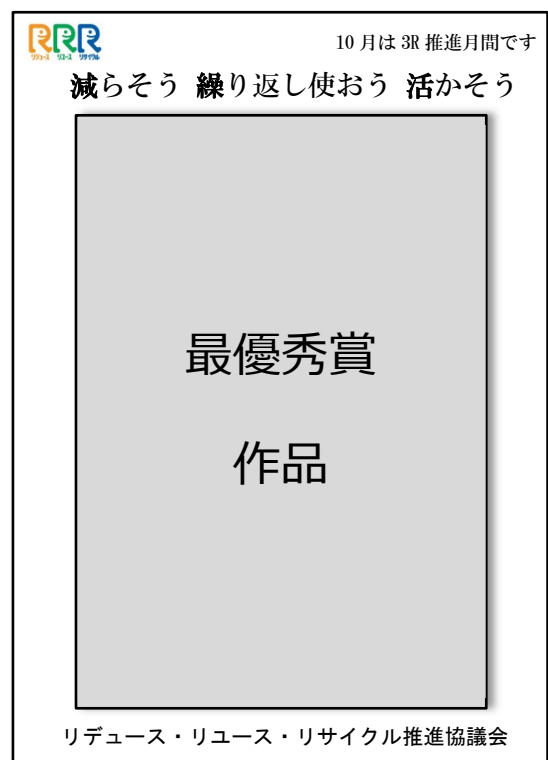
八つ切画用紙サイズの場合